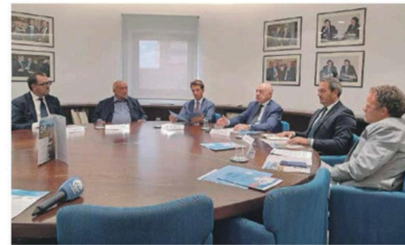
La conferenza stampa di presentazione di Frigo'n'motion, nella sede di Confindustria, a Bari

Il «giro d'Italia» del trasporto a temperatura controllata soeglie la Puglia per la decima tappa. Attesa per il documento scientifico sulle buone pratiche nel viaggio di frutta e verdura