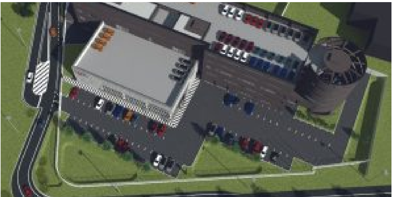
Lombarda Motori: aperto a Monza il nuovo terminal Audi