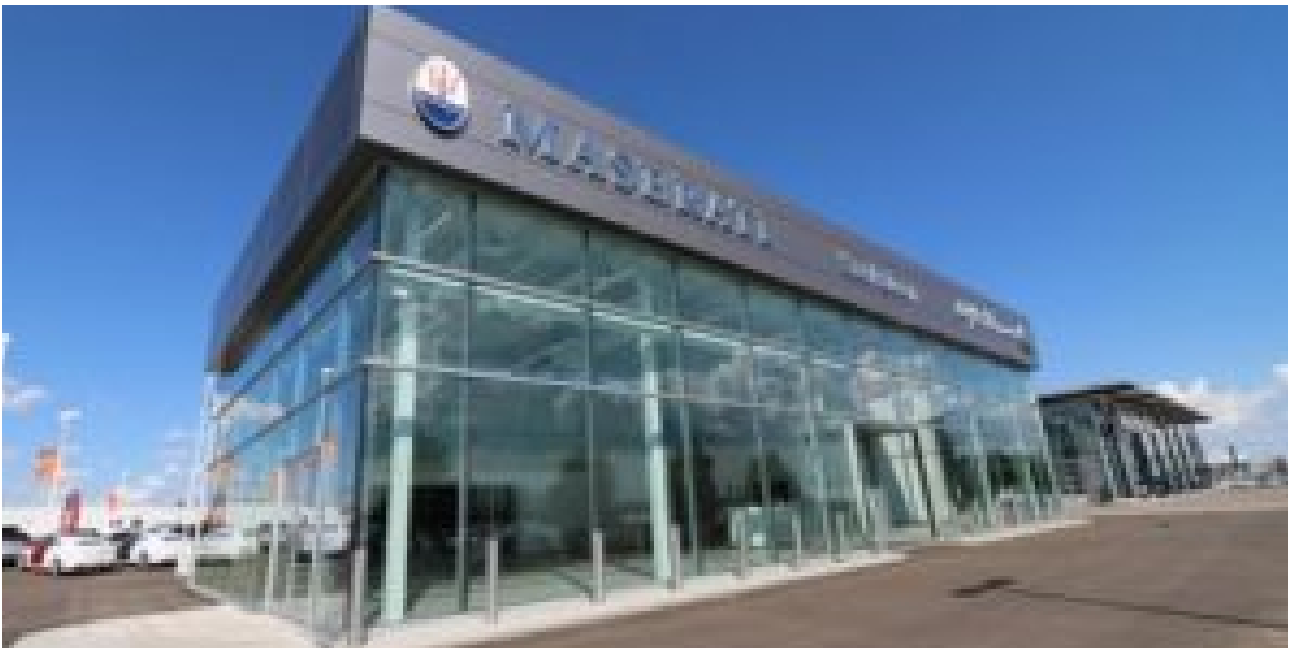
Showroom con la divisa, cosa sono gli standard